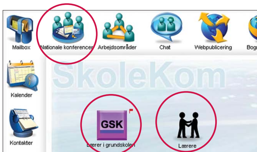
Udsnit af Skrivebordet, startbilledet i SkoleKom, hvor de tre indgange til de nationale konferencer er markeret.

Hvis vi antager at det er første gang du logger på SkoleKom, vil du nu have tre veje til de nationale konferencer.