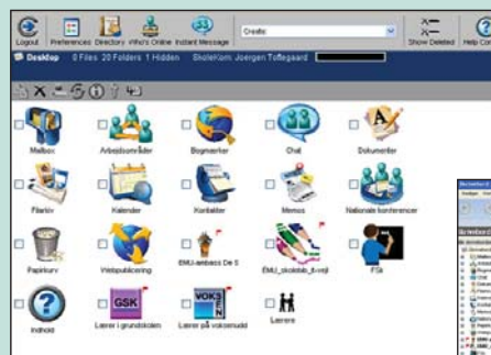
Indgangen fra www.skolekom.dk .

Den første indgang har den fordel at du umiddelbart kan bruge den fra alverdens computere. Den anden har den fordel at du kan nøjes med en mobiltelefon, men til gengæld er webfladen barberet for grafik. Den tredje giver en hurtigere tilgang med flere faciliteter, så den anbefaler vi at du bruger fra din egen computer. Du kan selv downloade og installere klienten som du finder på www.skolekom.dk under menupunktet Download.